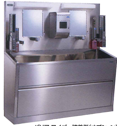
バリア・ワイパー装着例(オプション)